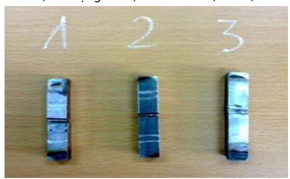
Hình 5. Mẫu thử nghiệm đô dai va đập

Mẫu thử nghiệm được gia công theo đúng kích thước tiêu chuẩn (dài x rộng x cao): 50 x 10 x 10 (hình 5).