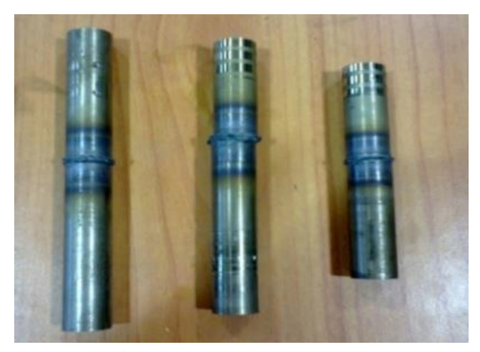
Hình 4. Mẫu mối hàn sau khi hàn thực nghiệm