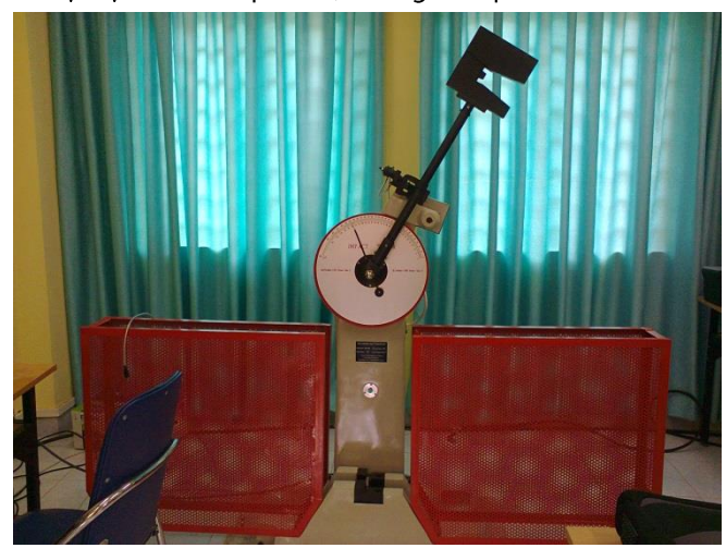
Hình 3. Máy thử đô dai va đập JBW- 300B

Vật liệu: Phôi thép CT38; đường kính phôi 16mm.