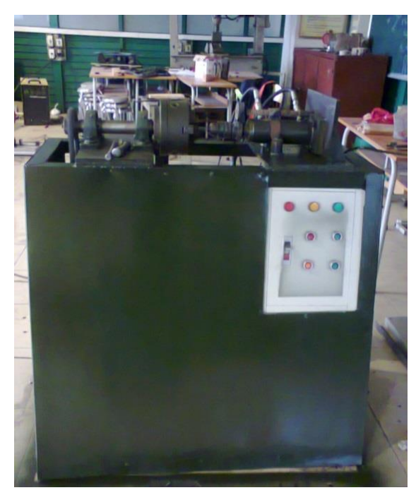
Hình 2. Máy hàn ma sát quay

Sử dụng máy thử độ dai va đập JBW- 300B (hình 3) tại phòng thí nghiệm vật liệu 103 A5 trường Đại học SPKT Nam Định để làm thí nghiệm thử va đập mẫu mối hàn.