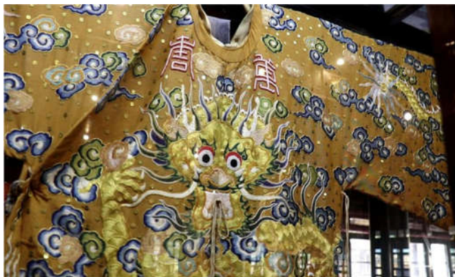
Hình 2. Long bào hoàng đế - trang phục Cung đình nhà Nguyễn

Qua những di chỉ khảo cổ được khai quật là những bàn dập hoa văn gốm cổ thuộc Văn hóa Hoa Lộc (nền văn hóa Việt cổ thế kỷ II trước Công nguyên) được khắc vạch nhiều mô típ hoa văn và ứng dụng để in trên vải hoặc trên người (tiền thân của tục xăm mình) [1]. Điều này cho thấy nghệ thuật trang trí đồ họa trên mẫu vải đã được hình thành ở Việt Nam từ rất sớm, tiếp tục hình thành và phát triển qua quá trình giống như những ngành nghệ thuật khác ở Việt Nam. Qua di sản nghệ thuật còn lưu giữ lại trên đồ gốm, đồ đá, gỗ qua các thời Đinh, Tiền Lê, Lý, Trần, Lê, Nguyễn có thể thấy rằng đã đạt được phong cách điển hình theo mỗi giai đoạn thời kỳ khác nhau. Đến thời Nguyễn, trước khi có sự du nhập của văn hóa Phương Tây, dưới ách thống trị của thực dân Pháp, thiết kế mẫu hoa văn trên vải hay thiết kế đồ họa mẫu vải vô cùng phong phú và đạt đến trình độ thẩm mỹ cũng như kỹ thuật thủ công rất cao.