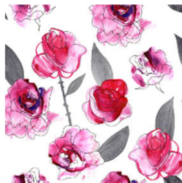
Hình 3. Họa tiết lấy cảm hứng từ tự nhiên

Mỗi nhóm trên lại chứa đựng nhiều phong cách và thiết kế riêng lẻ khác.