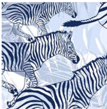
Hình 6. Họa tiết lấy cảm hứng từ sinh hoạt

Bốn nhóm chính này lại thường được kết hợp với nhau. Mặt khác, với sự hỗ trợ của phần mềm chuyên dụng thiết kế mẫu vải, quá trình thiết kế các mẫu hoặc họa tiết trở nên đơn giản, hiệu quả hơn nhiều. Sự đổi mới của in phun kỹ thuật số cũng đã cho phép quá trình in vải trở nên nhanh hơn, dễ mở rộng và thân thiện với môi trường hơn.