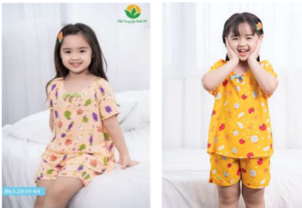
Hình 7. Trang phục trẻ em

Hoàn thành thiết kế mẫu vải vào tháng 09/2019, sau quá trình tiến hành thử nghiệm chất liệu, màu sắc, đưa vào in vải bằng kỹ thuật in trực đồng. Đến mùa Hè 2020, thương hiệu Công ty Cổ phần thời trang Việt Thắng cho ra mắt bộ sưu tập thời trang Hè 2020 “Đẹp từ nhà ra phố” sử dụng mẫu vải đã sáng tác.