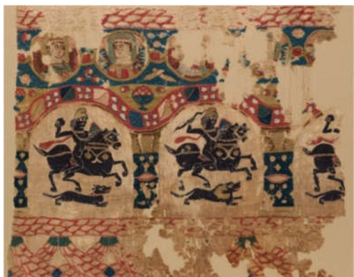
Hình 1. Một mảnh vải Coptic, Ai Cập, thế kỷ V

Hàng dệt may hoa văn ( vải dệt Coptic ) đã được tìm thấy trong các ngôi mộ cổ Ai Cập có niên đại từ cuối thế kỷ thứ III đến giữa thế kỷ VII. Hầu hết các tấm vải khảo cổ là mảnh thảm dệt, mảnh vụn quần áo bằng vải len, vải lanh, có hoa văn trang trí được dệt từ sợi len nhuộm. Thông qua tấm vải lanh cổ "Antinoe veil" mô tả một số cảnh trong thần thoại Hy Lạp, có niên đại từ thế kỷ thứ VI sau Công nguyên đã chứng minh được rằng hàng dệt có hoa văn đã được nhuộm sau khi dệt [12]. Ở châu Á, kỹ thuật này được thực hành ở Trung Quốc vào thời nhà Đường (618 - 907 sau Công nguyên), ở Nhật Bản vào thời Nara (645 - 794 sau Công nguyên), và ở Indonesia, người Java gắn liền với kỹ thuật này ( Batik ) từ năm 960 sau Công nguyên. Ở châu Phi với các bộ tộc Yoruba ở Nigeria, Soninke và Wolof ở Senegal [18].