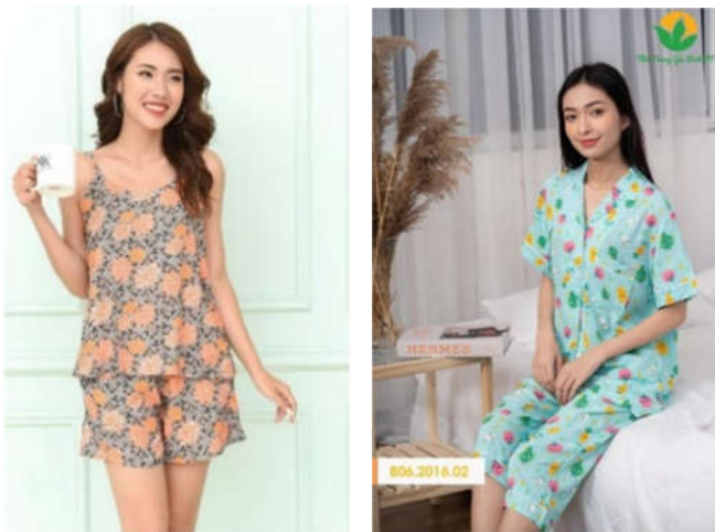
Hình 8. Trang phục người lớn

Đánh giá: Mẫu vải được triển khai theo quy trình thiết kế đồ họa mẫu vải, phù hợp xu hướng thời trang, thị trường, nhu cầu và sở thích của từng đối tượng khách hàng cụ thể. Các sản phẩm thời trang của Công ty Cổ phần thời trang Việt Thắng sử dụng vải đã sáng tác trên chất liệu vải lanh mềm mịn cùng kiểu dáng cơ bản với phong cách đơn giản, phom dáng rộng rãi thoải mái, giá cả phù hợp, tạo sự hài lòng và thích thú với khách hàng. Tuy nhiên, sản phẩm mang tính an toàn với các mẫu thiết kế trước, chưa tạo được điểm nhấn, sự khác biệt rõ rệt.